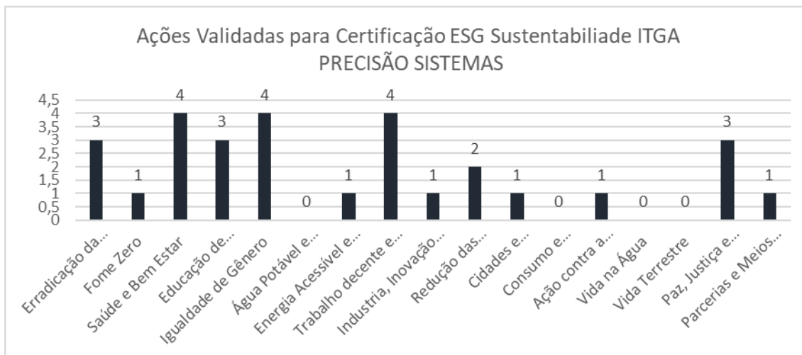
Gráfico 01: Ações Validadas para Certificação ESG Sustentabilidade ITGA.