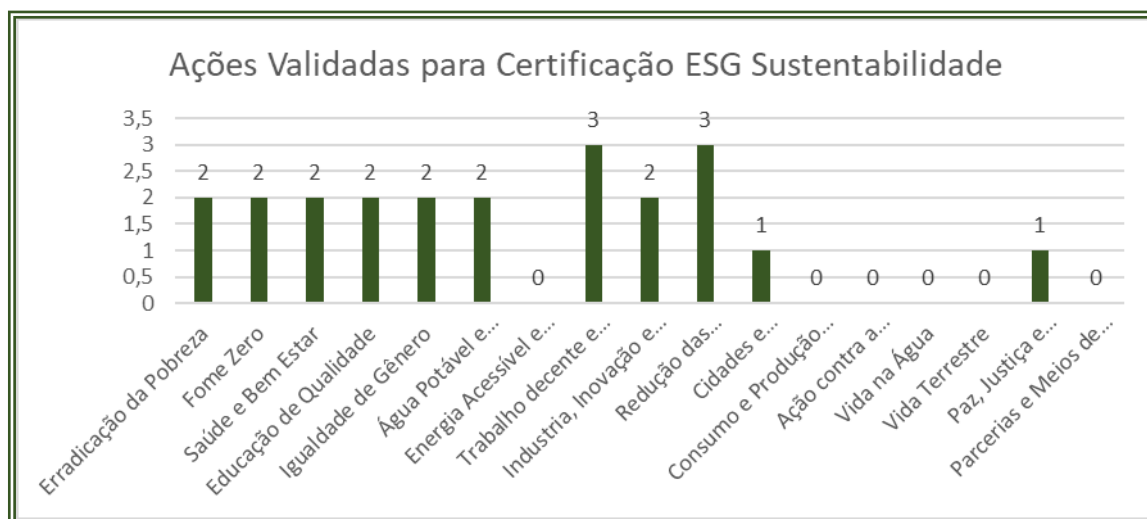
Gráfico 01: Ações Validadas para Certificação ESG Sustentabilidade ITGA.