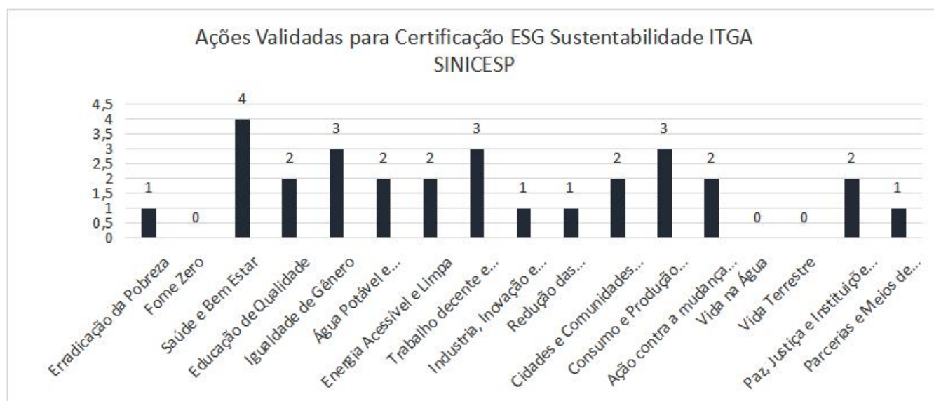
Gráfico 01: Ações Validadas para Certificação ESG Sustentabilidade ITGA.